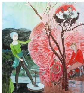
Rosa Loy, Drei Parzen 2016, Kasein auf Leinwand 210 x 190 cm, © Rosa Loy, VG Bild-Kunst, Bonn 2023, Droege Art Collection, Düsseldorf; Foto: Uwe Walter, Berlin