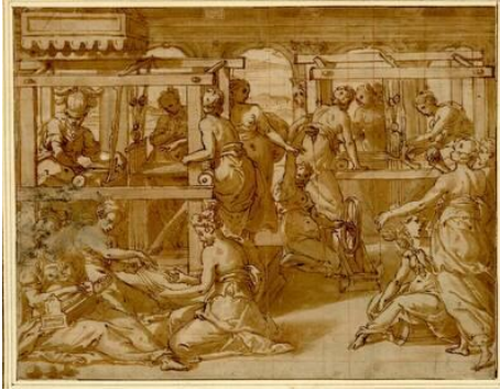
Cesare Nebbia, Der Wettstreit zwischen Minerva und Arachne im Weben (Ovid: Metamorphosen VI, 129–145), 1568–1570, Feder, laviert, Rötelpunktierung, Inv.-Nr. 486 ( https://sammlungenonline.albertina.at/?query=search=/record/objectnumbersearch=[486]&showtype=record)