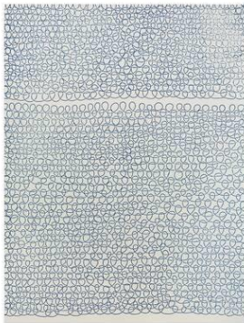
Rosemarie Trockel, Ohne Titel/Untitled (blue loops), 1996, Farbradierung auf Büten (BFK Rives) 118,6 x 88,1 cm, © Rosemarie Trockel und VG Bild-Kunst, Bonn 2023, Courtesy Sprüth Magers