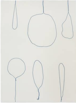
Rosemarie Trockel, Ohne Titel/Untitled (blue balloon), 1996, Farbradierung auf Bütten (BFK Rives), 118,6 x 88,1 cm, © Rosemarie Trockel und VG Bild-Kunst, Bonn 2023, Courtesy Sprüth Magers