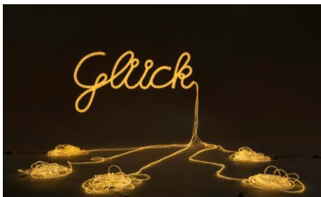
Heike Weber, Glück, 2014, © VG Bild-Kunst, Bonn 2023