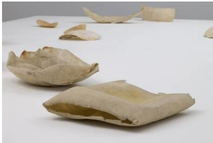
Eva Hesse, Ohne Titel (Teststücke), 1969, Käsetuch, Klebstoff, Papiercaché, © The Estate of Eva Hesse. Courtesy Hauser & Wirth; Foto: Thomas Müller