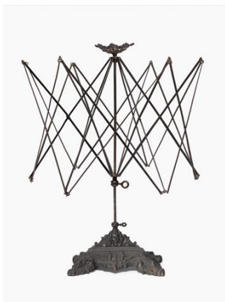
Haspel, ohne Datierung