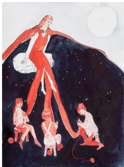
Rosa Loy, Drei Strickerinnen, 2018, Aquarell auf Papier 31 x 23 cm, © Rosa Loy, VG Bild-Kunst, Bonn 2023