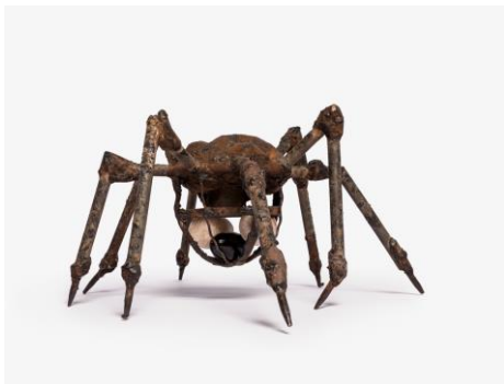
Louise Bourgeois, Spider, 1994 © The Easton Foundation / VG Bild-Kunst, Bonn 2023