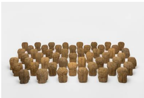
Magdalena Abakanowicz, Armless Backs, 1992, 51 Figuren aus Kunstharz und Sackleinen, © Ludwig Museum, Koblenz, 2023; Foto: Henning Rogge