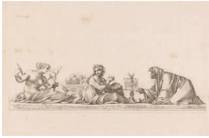
Alphonse-Victor Colas, Drie schikgodinnen, 1846, Radierung. Purchased with the support of the F. G. Waller-Fonds, Inv.-Nr. RP-P-1970-281, CCo 1.0 Universell (CCo 1.0) (URL http://hdl.handle.net/10934/RM0001.COLLECT.228539 )