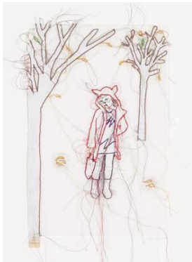
Vanessa Oppenhoff, Alone on a hill 8, 2011, © Draiflessen Collection, Vanessa Oppenhoff; Foto: Michael Klein