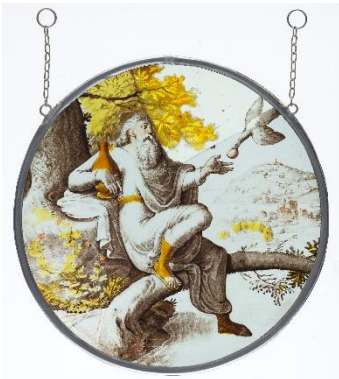
Elias, von Raben gefüttert | Elia, door raven gevoerd | Elijah Fed by Ravens, Südliche Niederlande | Zuidelijke Nederlanden | Southern Netherlands, 1525-1550, Draiflessen Collection (Liberna), Mettingen L-G2