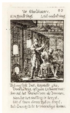
Der Glasbläser | De glasblazer | The glassblower, aus | uit | from: Jan & Casper Luyken, Het menselyk bedrijf, Amsterdam: Jan & Casper Luyken, 1694, Draiflessen Collection (Liberna), Mettingen W 380