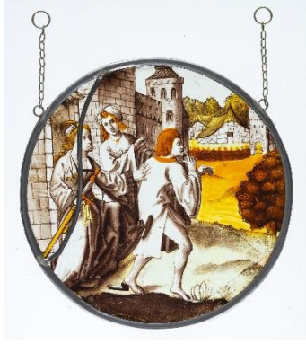
Der verlorene Sohn wird aus dem Bordell verjagt | De verloren zoon wordt uit het bordeel verjaagd | The Prodigal Son Turned Out by Harlots, Südliche Niederlande | Zuidelijke Nederlanden | Southern Netherlands, ca. 1540, Draiflessen Collection (Liberna), Mettingen L-G14