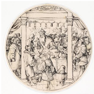
Umkreis Jörg Breu d. Ä. (wahrscheinlich eigene Werkstatt) | omgeving Jörg Breu de Oude (waarschijnlijk eigen atelier) | circle Jörg Breu the Elder (probably his workshop), Episode aus der Gesta Romanorum: Der Kaiser mit Page | Episode uit de Gesta Romanorum: De keizer met page | Episode from the Gesta Romanorum: The Emperor and the Page, um | omstreeks | about 1520, Draiflessen Collection (Liberna), Mettingen D 144, Foto | foto | photo: Stephan Kube, Greven