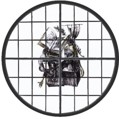
Joep Nicolas, Rundfenster mit Büste, Buch und Kelch | Rond raam met buste, boek en kelk | Round window with bust, book, and goblet, 1939, Draiflessen Collection, Mettingen Inv.-Nr. 110169, Foto | foto | photo: Stephan Kube, Greven