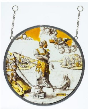
Allegorie der Geduld (Patientia) | Allegorie van het Geduld (Patientia) | Allegory of Patience (Patientia), Nördliche Niederlande | Noordelijke Nederlanden | Northern Netherlands, nach 1550 | na 1550 | after 1550, Draiflessen Collection (Liberna), Mettingen L-G15, Foto | foto | photo: Stephan Kube, Greven