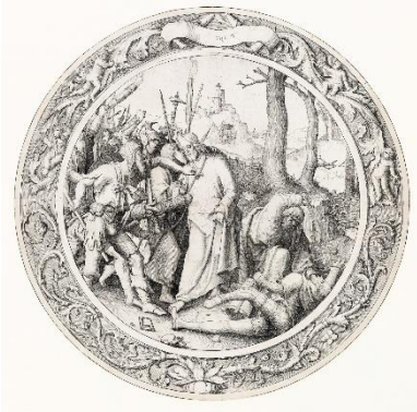
Lucas van Leyden, Die Gefangennahme Christi (aus der Runden Passie) | Het verraad van Christus (uit de Ronde Passie) | The Betrayal of Christ (Christ Taken Captive) (from the Circular Passion), 1509, Draiflessen Collection (Tuliba), Mettingen TP 0093, Foto | foto | photo: Stephan Kube, Greven