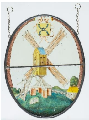
Mühle mit Müllerwappen | Molen met molenaarswapen | Mill with Millers' Coat of Arms, Nördliche Niederlande | Noordelijke Nederlanden | Northern Netherlands, 17. Jahrhundert | 17de eeuw | 17 th century, Draiflessen Collection (Liberna), Mettingen L-G 17