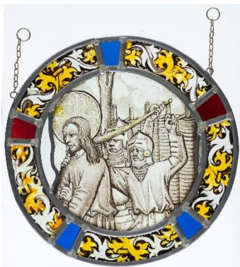
Die Gefangennahme Christi | De gevangenneming van Christus | The Arrest of Christ, Deutsch | Duits | German, 1490–1510?, Draiflessen Collection (Liberna), Mettingen L-G4