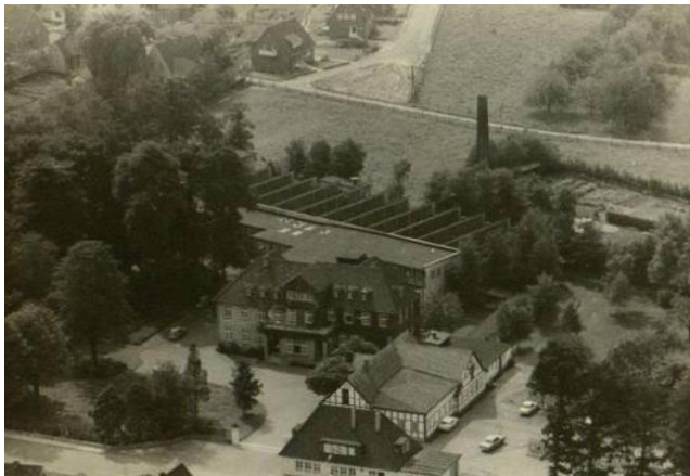
Luftbild der C&A-Eigenfabrikation „Herfa“ in Mettingen, Overgünne, nach 1954