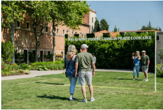
Renee van Bavel, THE MIRROR OF PEACE, 2022

© Renee van Bavel/Draiflessen Collection, Foto/photo: Marta Buso