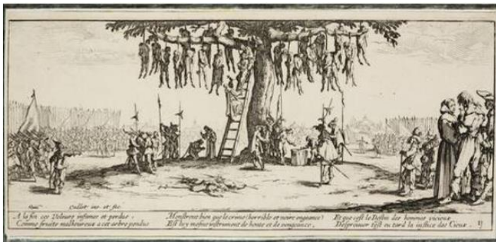
Jacques Callot, Les Grandes misères de la guerre, La pendaison, 1633 Draiflessen Collection, Foto/photo: Stephan Kube

© Renee van Bavel/Draiflessen Collection, Foto/photo: Marta Buso