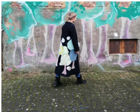
Anja Leshoff „So wie man in den Wald ruft, so schallt es heraus“, 2020/2021 © Anja Leshoff, Foto/photo: Marie-Therese Vinke