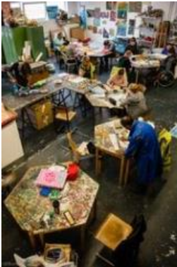
KunstContainer Osnabrück