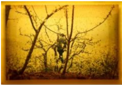
Maximilian Prüfer, Honey pictures 4, 2018 © Maximilian Prüfer