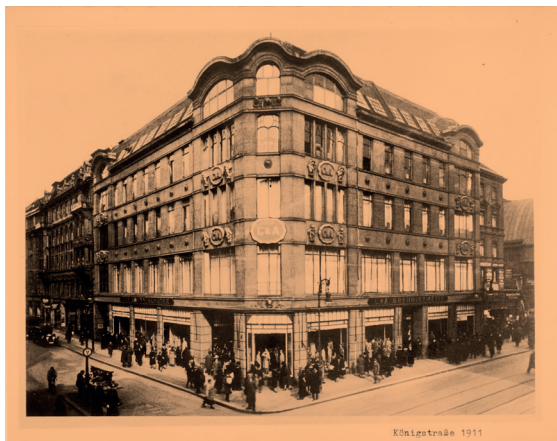
Fotografie, Stammhaus Berlin, um 1927