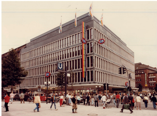
Fotografie, C&A Hamburg, 1985