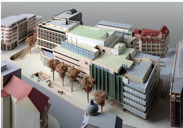
Architekturmodell, C&A Stuttgart, um 1991