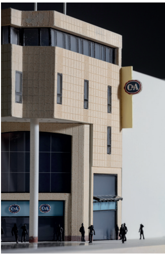
Architekturmodell (Detail), C&A Essen, um 1999