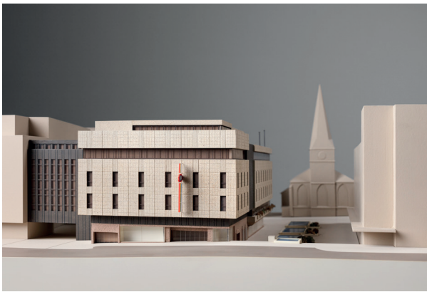
Architekturmodell, C&A Essen, um 1980 © Draiflessen Collection, Foto: HGEsch, 2024