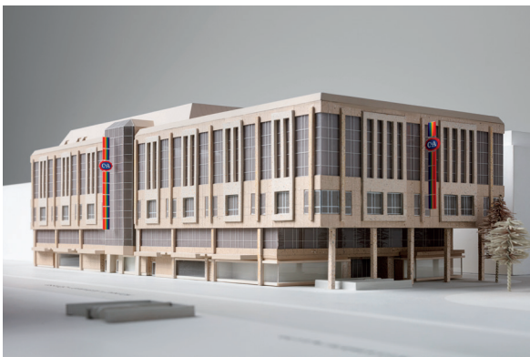
Architekturmodell, C&A Frankfurt, um 1988 © Draiflessen Collection, Foto HGEsch, 2024