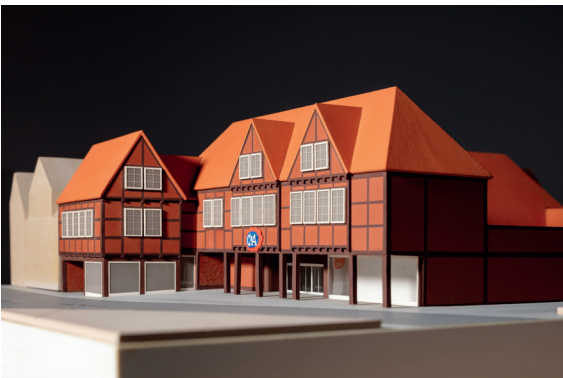
Architekturmodell, C&A Celle, um 1980 © Draiflessen Collection, Foto: HGEsch, 2023