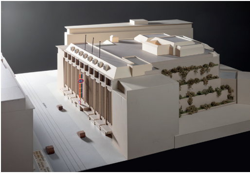
Architekturmodell, C&A Düsseldorf, um 1989