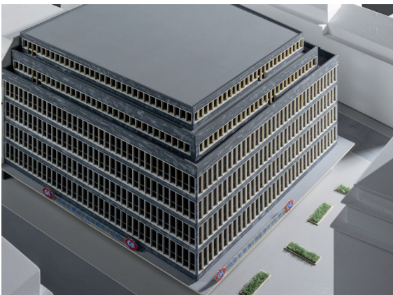
Architekturmodell, C&A Hamburg, um 1970