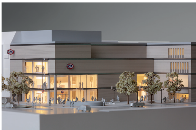
Architekturmodell, Berlin Steglitz, um 2010 © Draiflessen Collection, Foto: HGEsch, 2024