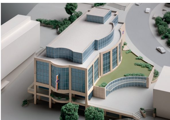
Architekturmodell, C&A Stuttgart, um 1991