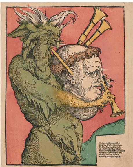
Erhard Schön (zugeschrieben), Des Teufels Sackpfeife, um 1530-1535 [als Faksimile in der Ausstellung]