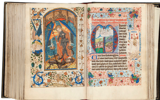
Nördliche Niederlande, Delft, Stunden- und Gebetbuch, ca. 1480, illuminiert vom Meister von Beatrijs van Assendelfts Vita Christi und den Meistern der Delfter Halbfiguren