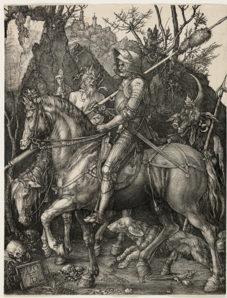
Albrecht Dürer, Ritter, Tod und Teufel, 1513