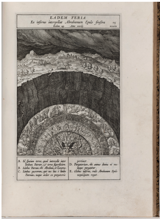
Hieronymus Natalis, Evangelicae Historiae Imagines. Adnotationes et Meditationes, Antwerpen: Martinus Nuyts der Jüngere, 1595