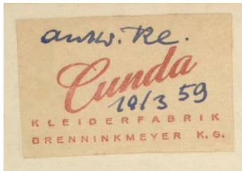
Absenderfreistempel der Cunda Kleiderfabrik Brenninkmeyer K.G., 19.03.1959