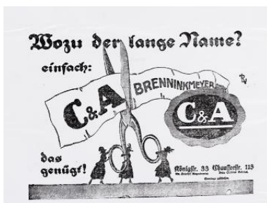
Anzeige C&A, 04.10.1917