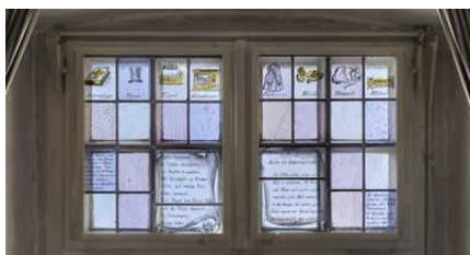
Humpisch-Fenster aus dem Gewölbe des Hauses Telsemeyer, Mettingen, zur Geheimsprache der Tüötten, © Draiflessen Collection