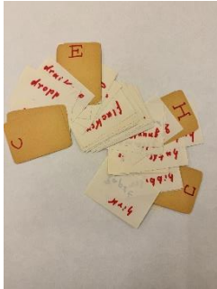
Vokabelkarten von Fritz Hettlage zur Geheimsprache der Tüötten